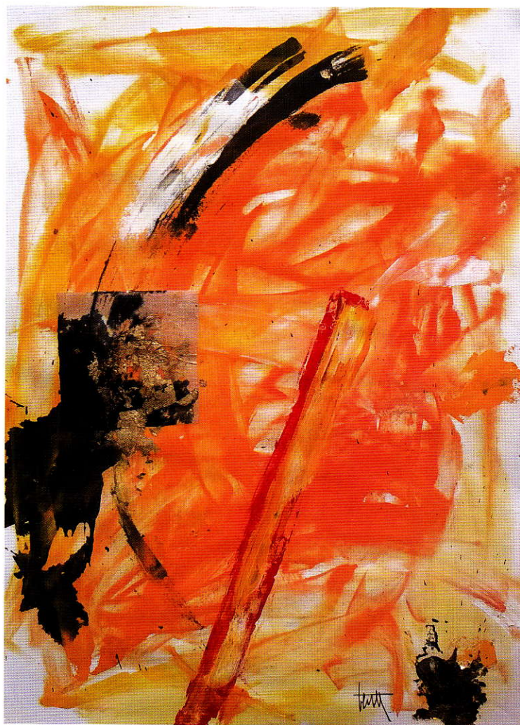
Choko-no-gedan , 70x50, tecnica mista su carta.