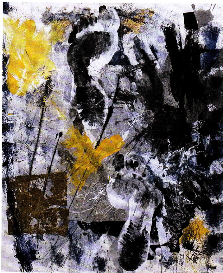
Unpo , 62x50, tecnica mista su carta.