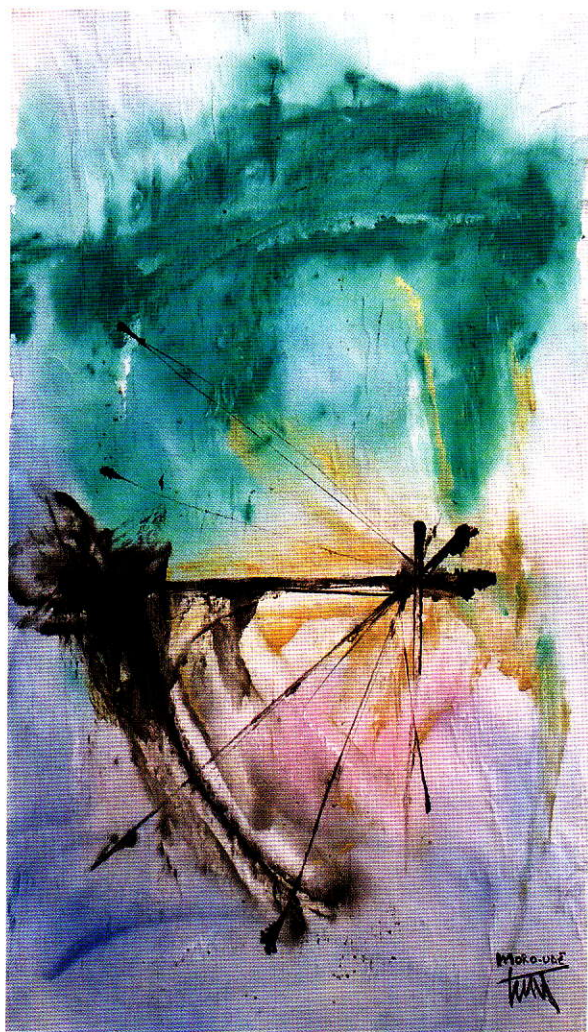
Mōrō-ude , 60x35, tecnica mista su carta.