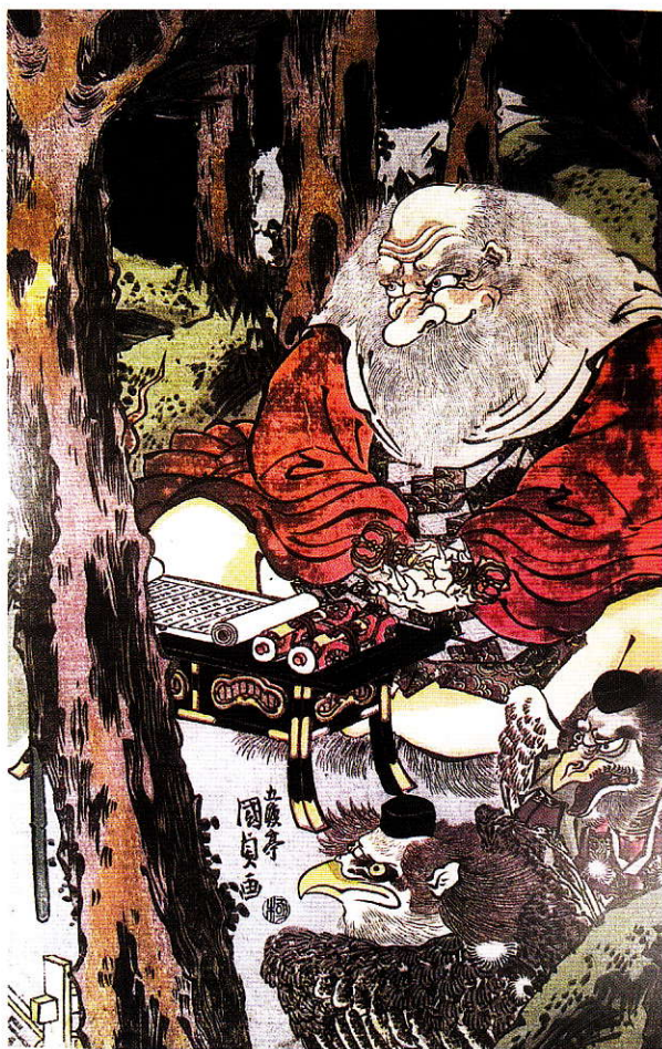
Sojo re dei Tengu con i rotoli della segreta sapienza (particolare da un trittico di Kunisada, 1815 ca.).